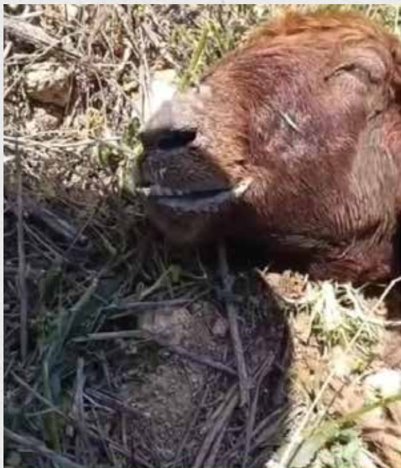
Animal Poisoning Terror in Judea and Samaria Arabs Poison Water Wells Used by Jewish Shepherds

אחת התופעות הקשות של הטרור המופנה מערבים מיהודה ושומרון היא הרעלת בארות ובעלי חיים. ביום 5.5.26 התגלה כי ערבים מהכפר חירבת אבו פלאח או אל מועייר הסמוכים לגוש שילה, הרעילו כעשרה בורות מים במרחב, מהם משקים יהודים את עדרי הצאן שלהם. את הדבר גילה רועה צאן יהודי כאשר הבחין בשמנונית במים וגילה כי כמה מהעיזים ששתו מהמים החלו לגסוס. העיזים הועברו לטיפול רפואי של וטרינר, וכוחות הביטחון הוזעקו למקום. בבדיקה מקיפה התגלתה הרעלה של כעשרה בורות מים.